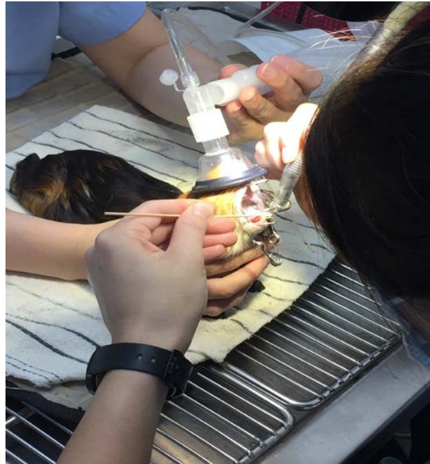
图二 天竺鼠磨牙手术

下进行跟诊实习和手术观摩，空闲的时候，我还会到侏罗纪野生动物专科医院当实习生。大陆地区的宠物诊疗行业中，往往以猫狗等伴侣动物为主，且宠物专科医院等也比较少见。而这两次实习的经历，我发现台湾的宠物医院里不仅有猫狗等伴侣动物，连大陆地区少见的绿鬣蜥、蜜袋鼯、天竺鼠等异宠也都是常客。