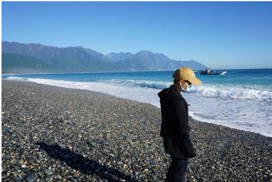
图四 花莲七星潭边

来到台湾，畅游美景是必不可少的。高美湿地的醉人日落，淡水老街的熙熙攘攘，在猫空缆车上鸟瞰台北夜景，在花莲七星潭听海浪拍打的声音……这些似乎是断断续续、零零碎碎的片段，往往在离开之后，自然而然地拼凑成了一本影像集，一部电影，在脑海里循环播放，让人格外想念。台湾的美景最常给我的，是一种温和而美好的感受，身处其境时总想闭上眼睛，仿佛可以听到自己呼吸的声音，感受心跳的快慢与脉搏的律动，那是大自然带来的一种平和。