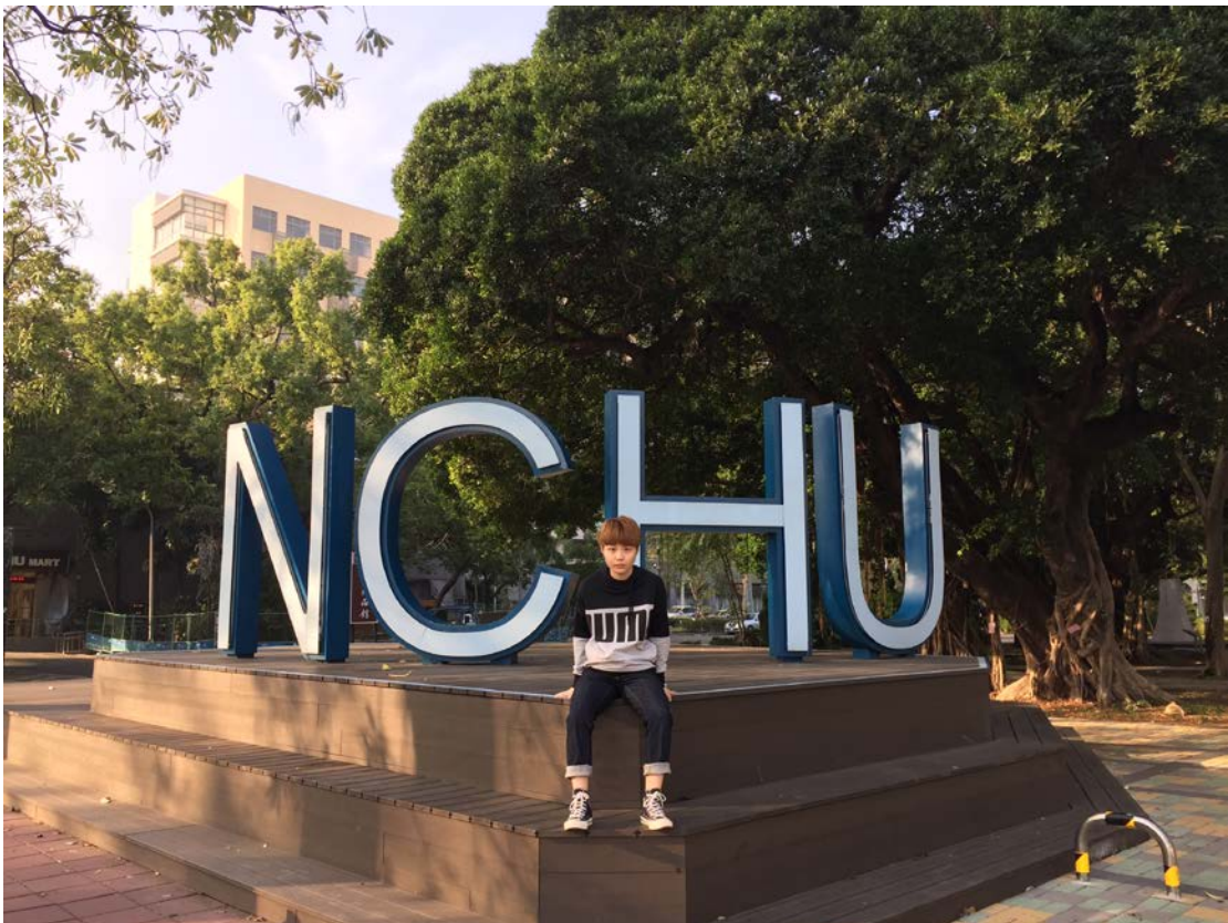
图六 中兴大学灯牌

希望各奔东西的大家一切安好，相信怀揣着这份感动和信念，我们终将成为心中的那个人。