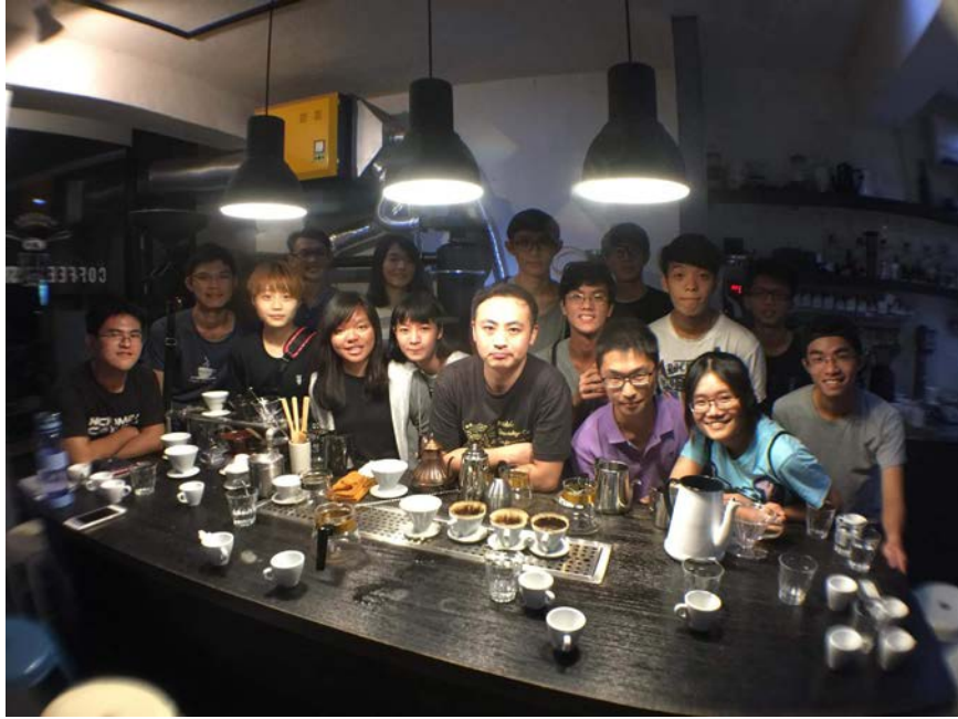
图三 精品咖啡研习社巡礼